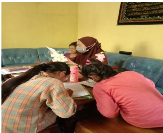
Gambar 4. Proses tanya jawab antara siswa.

pemateri menjawab atau pemateri bertanya, siswa yang menjawab. Dalam komunikasi ini terlihat adanya hubungan timbal balik secara langsung antara pemateri dengan peserta. Metode tanya jawab ini bertujuan untuk mengetahui sampai sejauh manamateri dapat sampai pada peserta; untuk merangsang peserta pengabdian berpikir; dan memberi kesempatan pada peserta untuk mengajukan permasalahan. Para siswa pun secara tidak langsung dilatih untuk berani berinteraksi dengan teman- temannya maupun pengajar yang sedang memberikan materi.