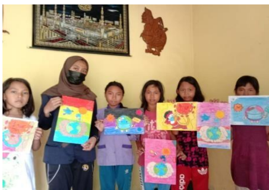
Gambar 7. Gambar hasil kerja siswa.