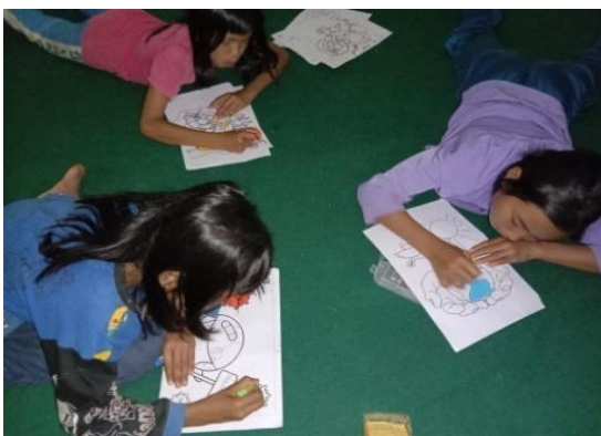
Gambar 6. Menggambar dan mewarnai di sela-sela belajar untuk mengurangi kejenuhan