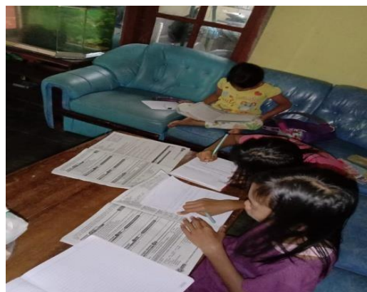
Gambar 1. Proses pendampingan belajar di rumah warga dusun dampit, desa lipursari

Dalam kegiatan tatap muka ini, siswa mendatangi rumah posko KPM yang bertempat di Dusun Dampit, Desa Lipursari, kemudian dilanjut dengan menanyakan tugas yang masih mengalami kesulitan kepada anak-anak tersebut serta menanyakan materi atau pelajaran yang dirasa masih mengalami kebingungan. Selanjutnya masuk ke tahap pembahasan (ceramah) yang dilakukan dengan menjelaskan ke anak-anak secara pelan- pelan dan berulang-ulang agar anak tersebut bisa memahaminya. Penggunaan metode inidengan pertimbangan bahwa metodeceramah yang dikombinasikan dengan gambar-gambar dan tulisan di papan tulis dapat memberikan materi yang relatif banyak secara padat, cepat, dan mudah.