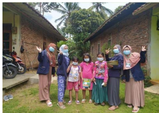
Gambar 3. Proses pendampingan belajar di dusun dampit, desa lipursari.