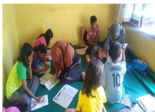
Gambar 2. Proses pendampingan belajar di posko kpm rumah warga dusun dampit, desa lipursari