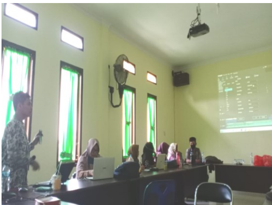
Gambar 7. Tim dosen berdiskusi dengan peserta

Pada Gambar 7 tim dosen sedang menjawab pertanyaan peserta dalam sesi diskusi terdapat beberapa peserta yang mengajukan