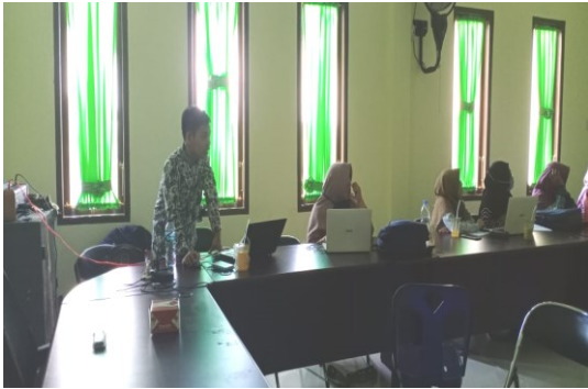
Gambar 6. Tim dosen memberikan informasi tentang aplikasi filmora

Pada Gambar 6 terlihat salah satu tim dosen sedang menyampaikan informasi dengan metode ceramah tentang persiapan yang dibutuhkan untuk melakukan pembuatan konten kreatif.