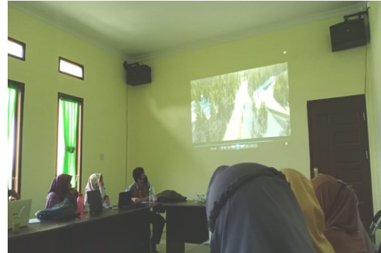
Gambar 8. Peserta mengikuti sesi praktik