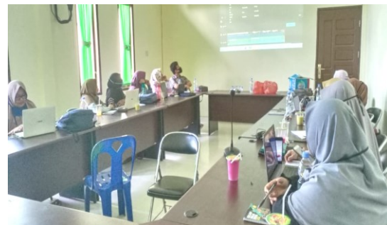
Gambar 9. Demo aplikasi filmora di depan para peserta pkm