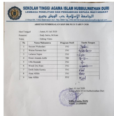
Gambar 4. Lembar absensi hari pertama

Bukti kehadiran para peserta dapat dilihat pada Gambar 4 di bawah ini: