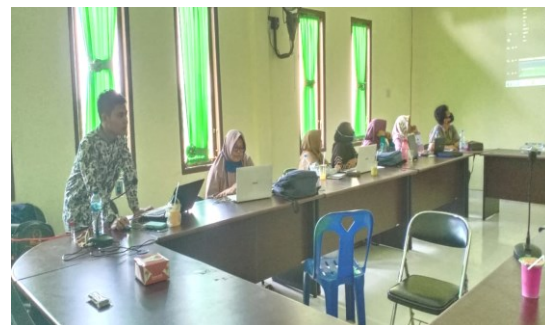
Gambar 10. Tim dosen mempraktikkan penggunaan aplikasi filmora

Pada Gambar 10 terlihat tim dosen dan para peserta yang mengikuti kegiatan pkm ini melihat beberapa hasil video yang sudah diedit lalu dibuat kembali dengan cara praktik langsung di hadapan peserta pkm.