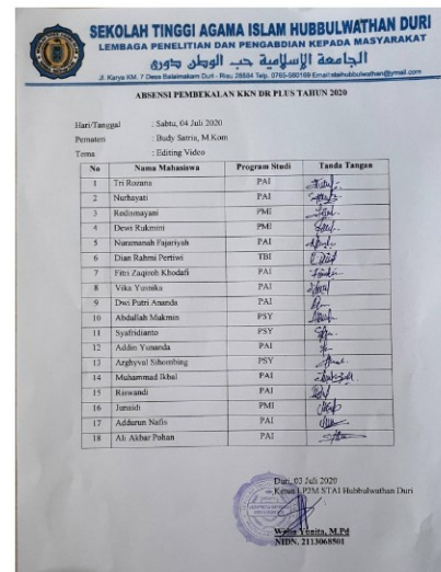
Gambar 5. Lembar absensi hari kedua