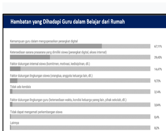
Gambar 1. Hasil survey hambatan yang dihadapi guru dalam belajar dari rumah

Berdasarkan hasil survei cepat pembelajaran dari rumah selama masa pandemi Covid-19 yang dilakukan oleh kemendikbud, terdapat hambatan-hambatan yang di alami oleh pihak sekolah maupun siswa yang dapat dilihat pada gambar 1 berikut ini :