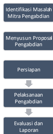
Gambar 3. Tahapan pelaksanaan pengabdian

Setelah ditemukan permasalahan guru-guru pada SMP Bina Cipta Palembang, maka tim dosen Institut Teknologi dan Bisnis Palcomtech membuat susunan metode pengabdian yang terdiri dari tahapan-tahapan pelaksanaan serta indikator capaian yang diharapkan untuk memberikan solusi permasalahan yang telah dipaparkan sebelumnya. Tahapan-tahapan kegiatan pengabdian masyarakat pada SMP Bina Cipta Palembang dapat dilihat pada gambar 3 berikut ini :