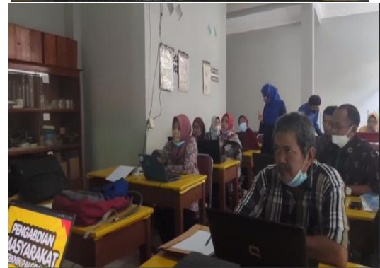
Gambar 6. Peserta Mendengarkan Pemaparan Materi