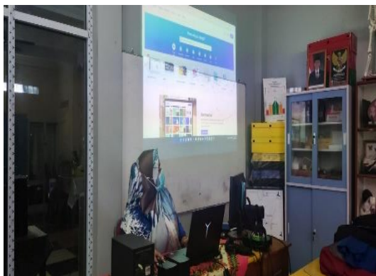
Gambar 5. Tim dosen melakukan pemaparan materi

Pada sesi ini tim dosen menjelaskan materi tentang aplikasi Canva Web mulai dari pengenalan aplikasi, fitur-fitur yang disediakan oleh Canva Web, keunggulan dari Canva Web dibandingkan dengan aplikasi lain yang sejenis, cara membuat bahan ajar melalui aplikasi Canva Web sampai dengan tips memilih template yang sesuai dengan mata pelajaran yang ada.