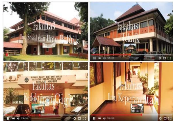
Gambar 12. Contoh video profile Universitas Indonesia