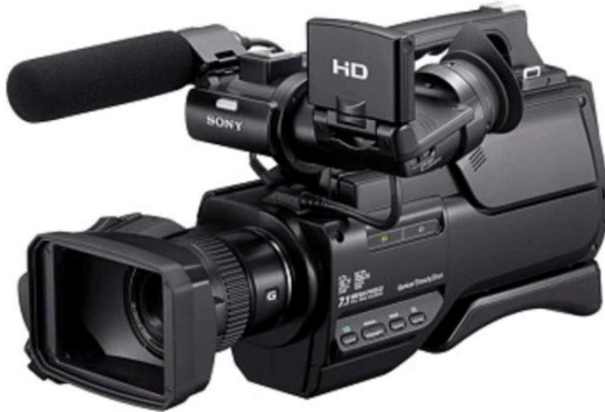
Gambar 9. Contoh kamera video pemakaian di darat

Kwalitas gambar video yang dihasilkan juga ditentukan oleh kamera yang digunakan. Semakin tinggi resolusi kameranya maka gambar video yang dihasilkan akan semakin baik.