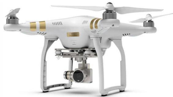
Gambar 7. Contoh Drone menggunakan kamera video

Pengambilan video dari udara dilakukan dengan menggunakan drone .