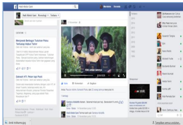
Gambar 13. Contoh tampilan video profile perguruan tinggi yang di upload di facebook