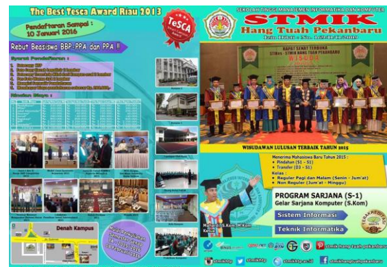
Gambar 4. Contoh brosur STMIK Hang Tuah Pekanbaru

Penyampaian brosur perguruan tinggi di Pekanbaru dilakukan oleh beberapa perguruan tinggi dengan cara roadshow ke seluruh sekolah yang ada di provinsi Riau ataupun sekolah yang berada di provinsi tetangga seperti Sumbar dan Jambi. Ada juga dengan cara mengikuti pameran perguruan tinggi yang diadakan oleh lembaga tertentu. Namun cara lain dilakukan juga oleh beberapa perguruan tinggi dengan memanfaatkan media sosial seperti facebook dan instagram. Brosur perguruan tinggi di upload di media sosial tersebut.