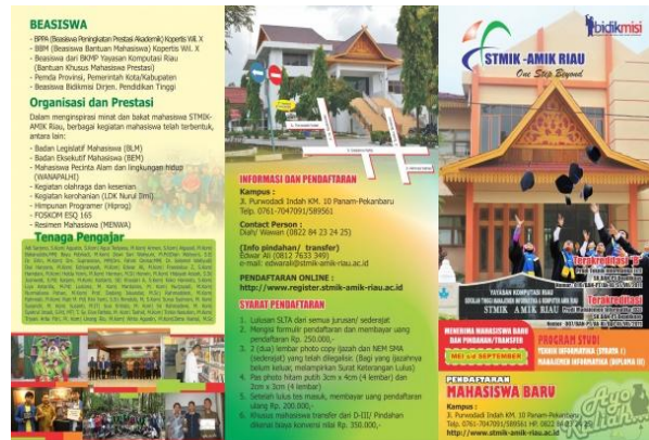
Gambar 3. Contoh brosur STMIK Amik Riau

Berikut contoh-contoh brosur yang ada untuk perguruan tinggi swasta dalam memasarkan produk mereka.