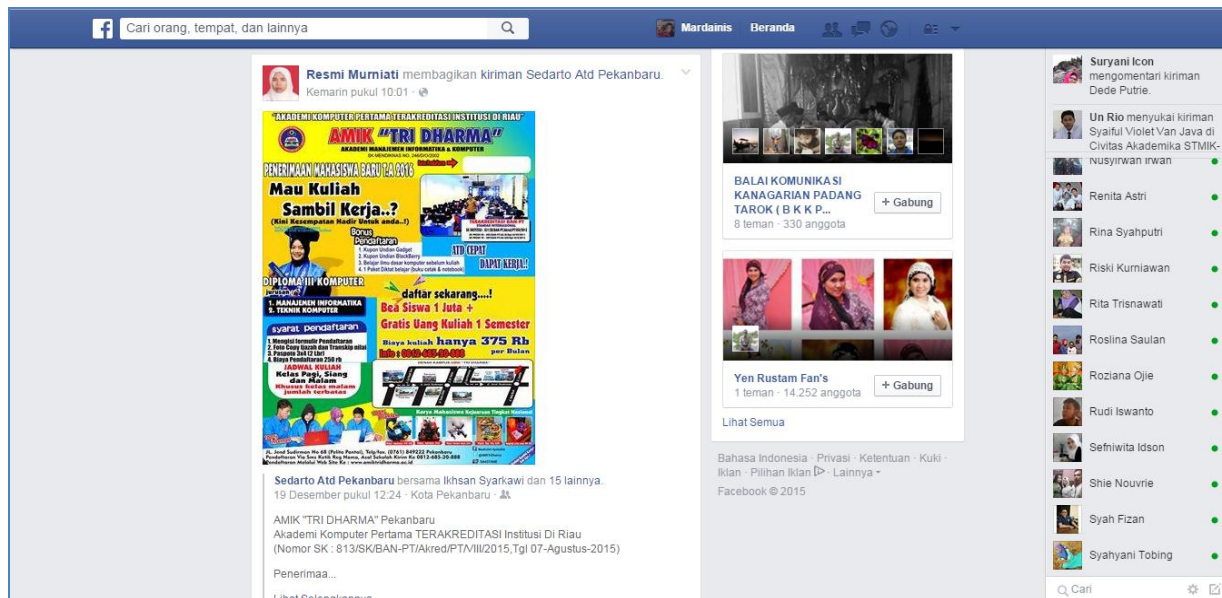
Gambar 5. Contoh tampilan brosur dalam facebook

termasuk perguruan tinggi. Dengan adanya video profile perguruan tinggi dapat disajikan informasi lebih lengkap terkait sarana dan prasarana yang ada. Termasuk juga dapat menyampaikan suasana perkuliahan yang ada di perguruan tinggi dimaksud.