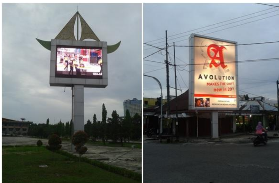
Gambar 6. TV Media Iklan dan Billboard yang ada dikota Pekanbaru

sangat bagus digunakan karena akan dapat dilihat langsung oleh masyarakat. Jika dipandang dari sisi marketing penayangan video di tempat media iklan, pesan yang disampaikan akan langsung dilihat oleh masyarakat.