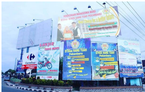
Gambar 2. Contoh pemasangan baliho iklan kampus

Spanduk dan baliho merupakan media iklan jangka pendek berbahan kain atau plastik yang dipasang tidak permanen. Ukuran spanduk lebih kecil dibandingkan baliho. Baliho adalah spanduk dalam ukuran yang besar yang berisikan iklan seperti informasi tentang perguruan tinggi. Karena ukurannya yang besar pemasangan baliho biasanya menggunakan billboard yang sudah terpasang permanen di daerah strategis yang selalu ramai dilalui orang. Pemasangan baliho di billboard lebih aman dan punya penerangan serta tidak perlu khawatir akan hilang, karena pemasangan baliho di billboard adalah sistem sewa ke pemilik billboard .