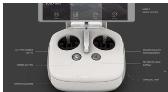
Gambar 8. Contoh Alat kontrol Drone

Drone DJI dapat bertahan terbang selama 23 menit. Jadi pastikan harus sudah turun sebelum menit ke 23. Untuk berjaga-jaga sebaiknya menerbangkan Phantom 3 sekitar 20 menit.