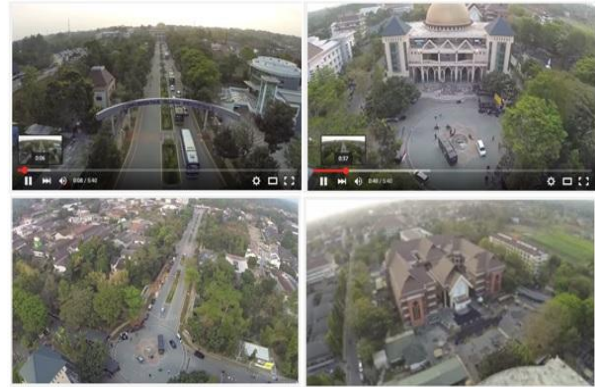
Gambar 11. Contoh video profile Universitas Islam Indonesia