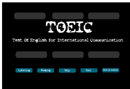
Gambar 2. Menu pilihan

Setelah masuk di tampilan play lalu klik tombol play kemudian akan masuk pada tampilan pilihan, dimana terdapat beberapa pilihan