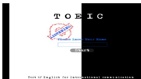
Gambar 3. Tampilan listening

Pada tampilan pilihan ada 5 pilihan yaitu Listening , Reading , help , exit dan exit to windows . Apabila kita memilih tombol listening maka akan masuk pada tampilan listening