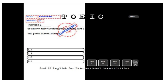
Gambar 4. Tampilan pertanyaan listening