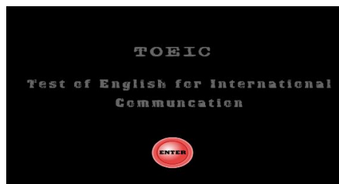
Gambar 1. Tampilan awal aplikasi

Untuk menjalankan aplikasi ini klik file 1.exe lalu akan muncul tampilan Startgame (ENTER)